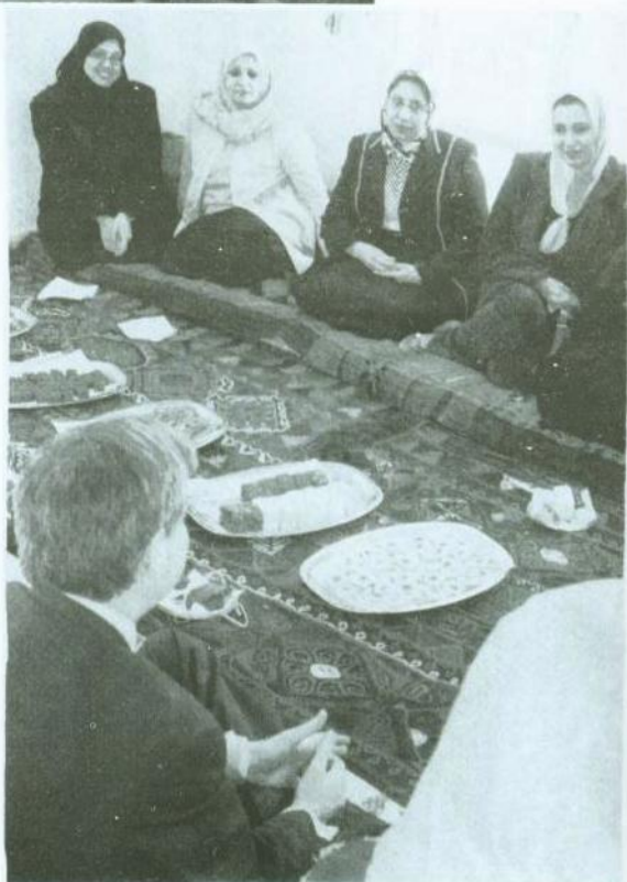
افتتاح المركز النسائي ببغداد في يوم المرأة العالمي، 8 آذار/مارس 2004